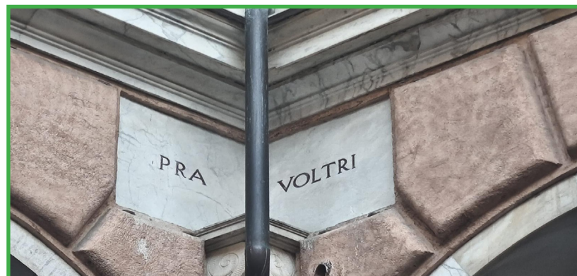
Nel porticato di Palazzo Tursi, sede del Comune di Genova, sono state posizionate targhe in marmo con i nomi dei comuni accorpati nel 1926, tra cui PRA'

le vie. Castelluccio, Torre Cambiaso, Punta Martin, ville storiche e le Ex-Officine Verrina si trovano tutti sul territorio storico di Pra'. La confusione attuale deriva da scelte amministrative successive e dalla mancanza di chiarezza nella comunicazione ufficiale.