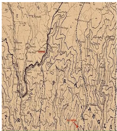
Il territorio del Comune di Pra'

Quando l'identità di un territorio viene cancellata per decreto, ma non dalla memoria