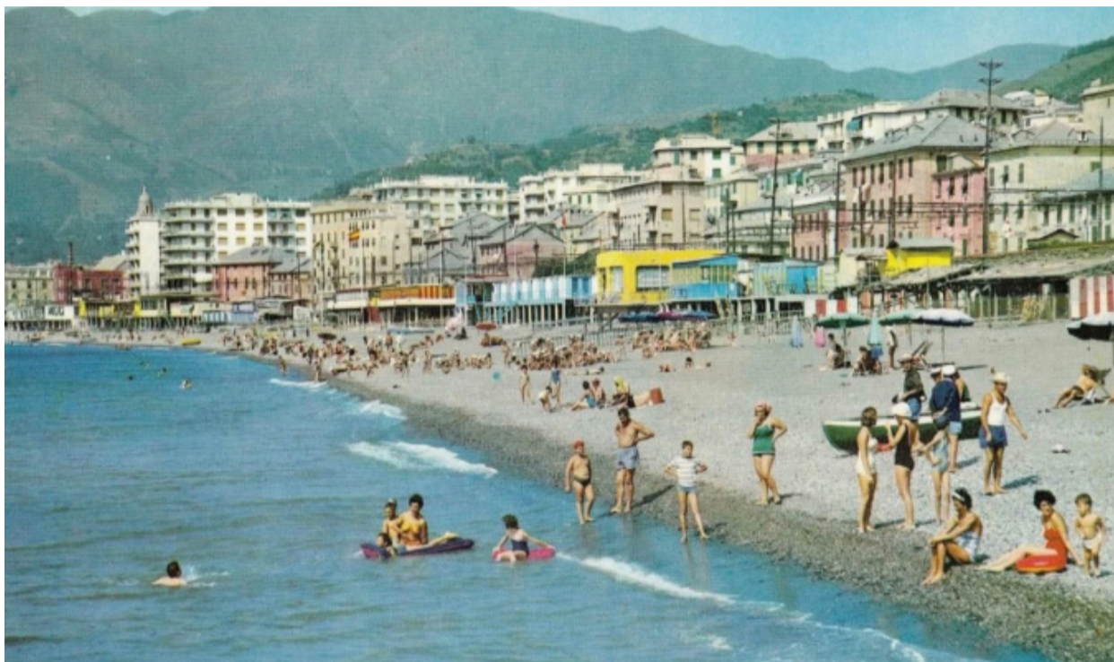
La Spiaggia di Pra' prima della costruzione del Bacino Portuale di Pra'

Cento anni dopo, le identità cancellate tornano a chiedere voce, rappresentanza e futuro